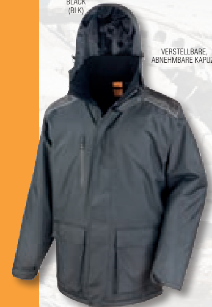
VERSTELLBARE ABNEHMBARE KAPUZE