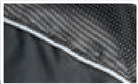
KONTRASTPASPELN AUS DOBBY MATERIAL